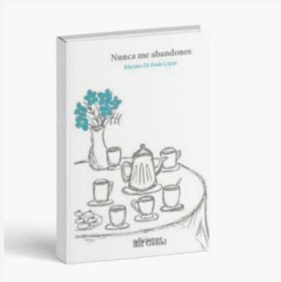
Nunca me abandones / Martina Di Paula López. Málaga: Ediciones del Genal, 2024.