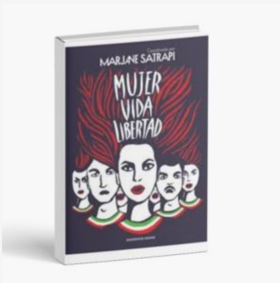
Mujer Vida Libertad / coordinado por Marjane Satrapi. Barcelona: Penguin Random House, 2023.