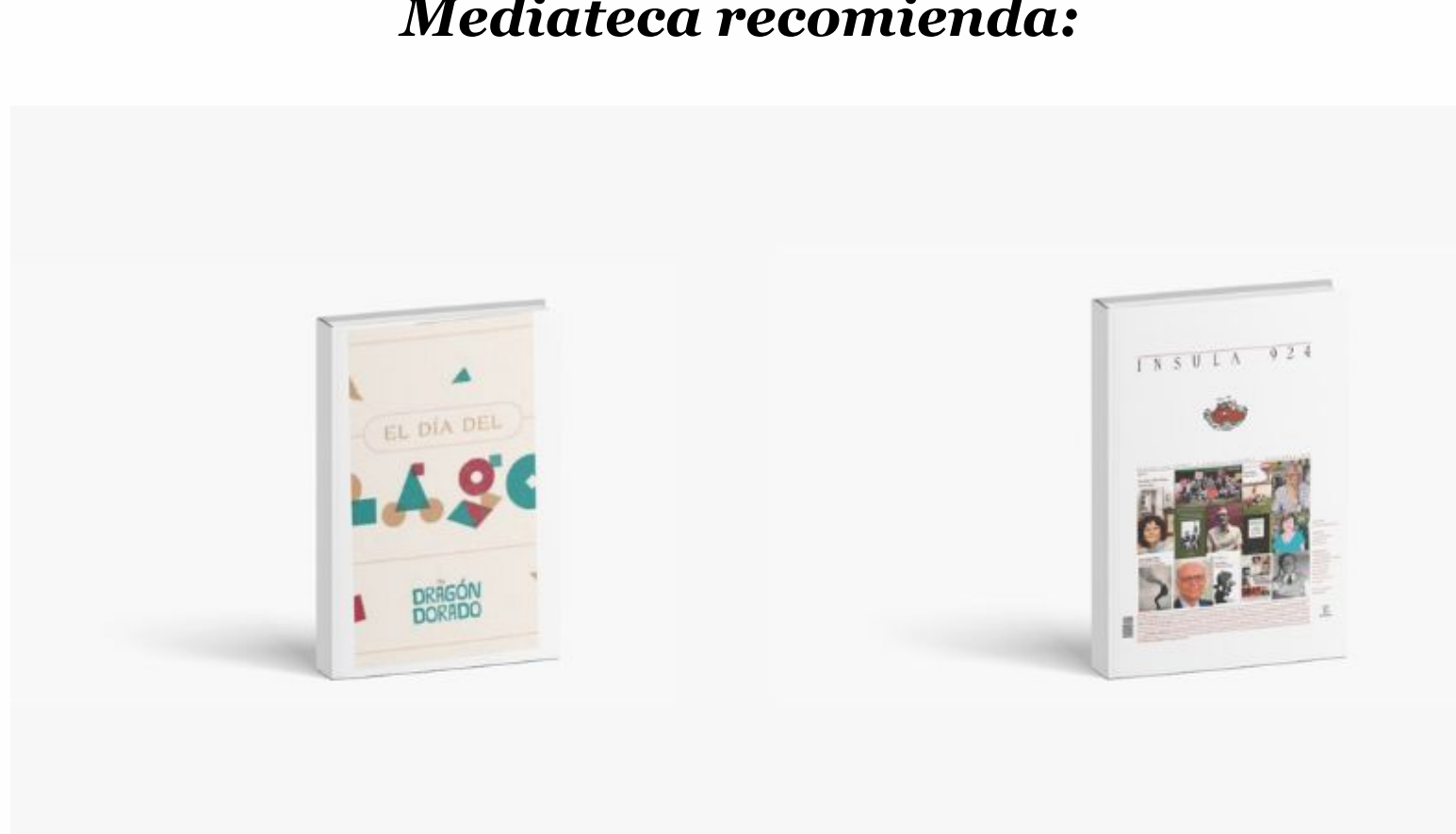
El día del dragón / Natacha Ortega, Mauricio Gelardi. [S.L.]: Dragón Dorado, 2024