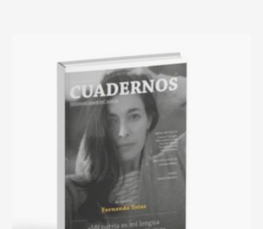
Cuadernos Hispanoamericanos. Madrid: Agencia Española de Cooperación Internacional (AECID). 2024 (888).