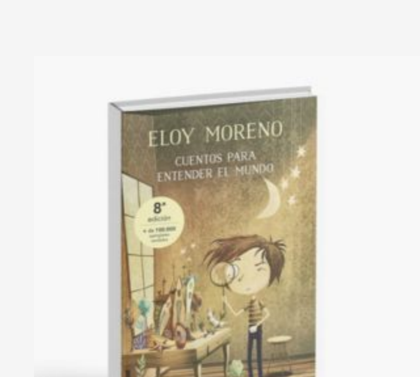
Cuentos para entender el mundo / Eloy Moreno; ilustraciones de Pablo Zerda. Barcelona: Maxi: B de Bolsillo, 2020.