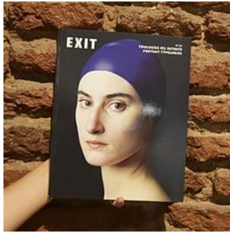
Revista Exit: Imagen y Cultura (nº 87). Madrid: Rosa Olivares Asociados, 2022.