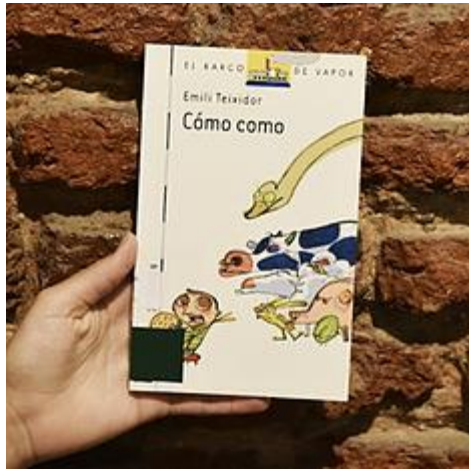
Cómo como / Emili Teixidor, ilustraciones de Lluís Farré. 2º ed. Boadilla del Monte (Madrid): SM, 2008