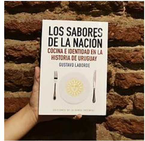
Los sabores de la nación. Cocina e identidad en la historia de Uruguay / Gustavo Laborde. Montevideo: Banda Oriental - SARAS, 2022