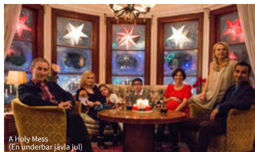
A Holy Mess (En underbar jävla jul)