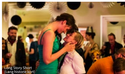
Long Story Short (Lang historie kort)