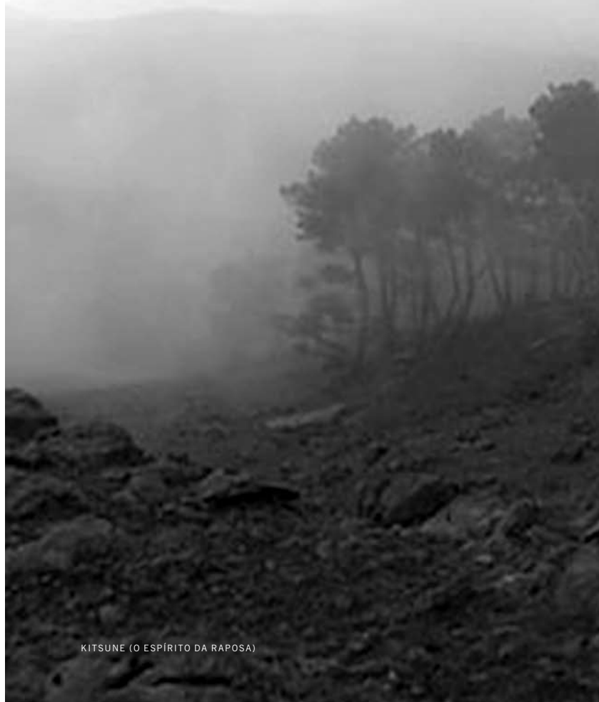
KITSUNE (O ESPÍRITO DA RAPOSA)

QUIENES SEAN SELECCIONADOS/AS Y ASISTAN A LAS DOS JORNADAS RECIBIRÁN UN CERTIFICADO. EN EL MARCO DEL PROGRAMA PAÍS IBEROAMERICANO: PORTUGAL