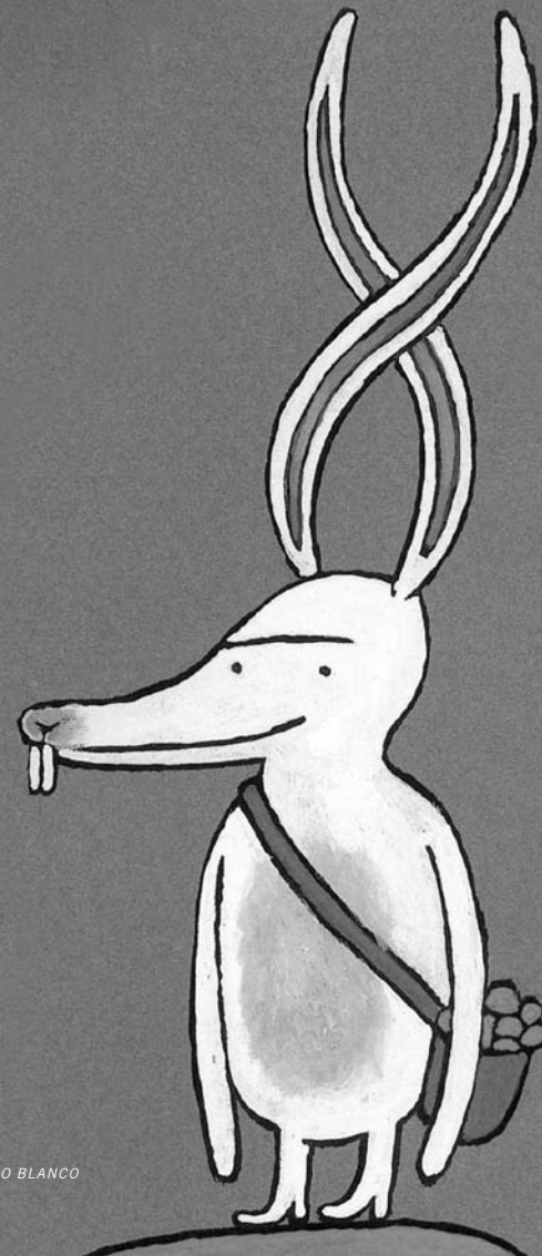
EL PEQUEÑO CONEJO BLANCO

Video arte: Video arte e filme de arte & ensaio em Portugal , de Dinis Guarda.