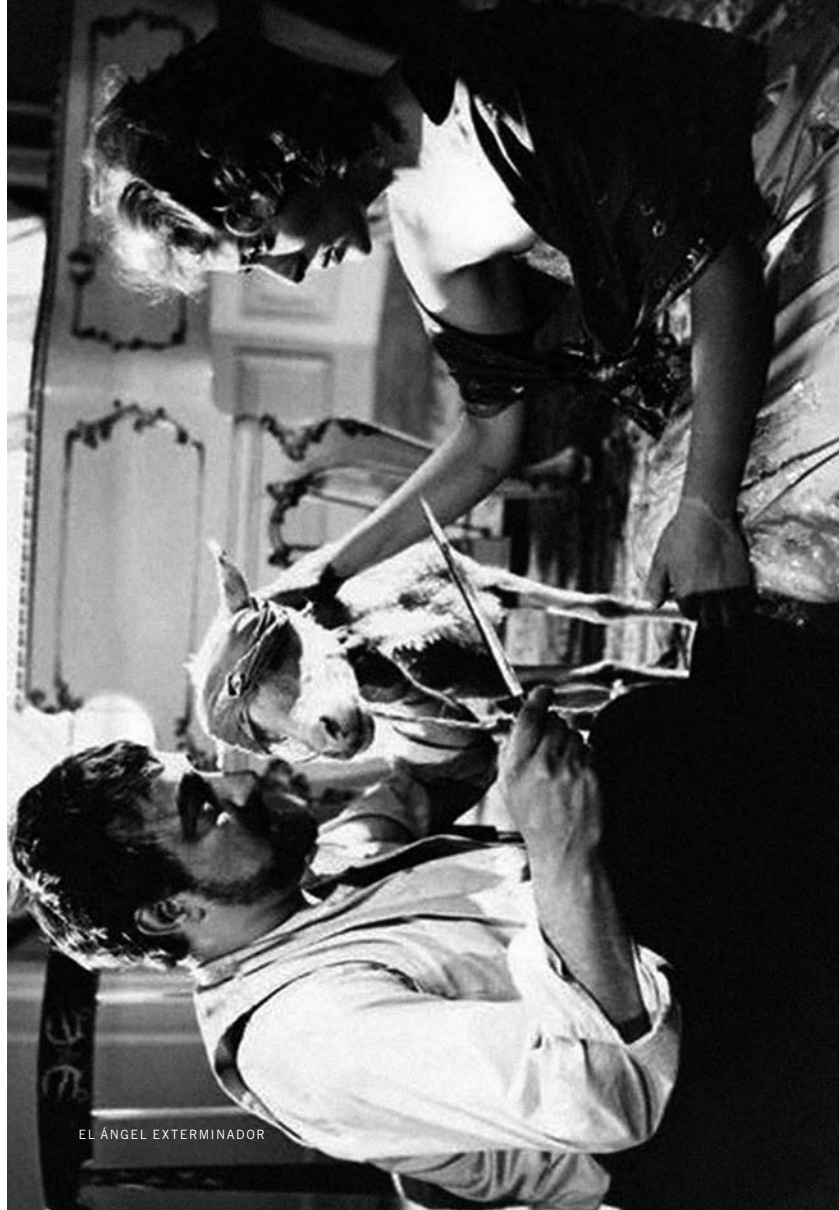
EL ÁNGEL EXTERMINADOR