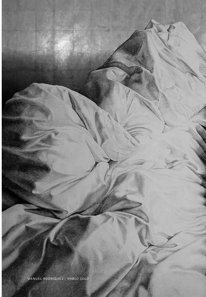
MANUEL RODRÍGUEZ / HABLO SOLO