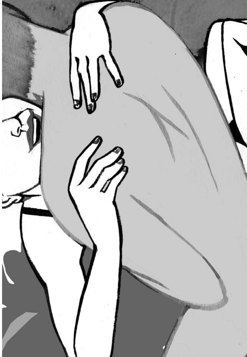
CICLO ERÓTICA AUSTRALIS / ILUSTRACIÓN: ALVARO PEMPER, DETALLE