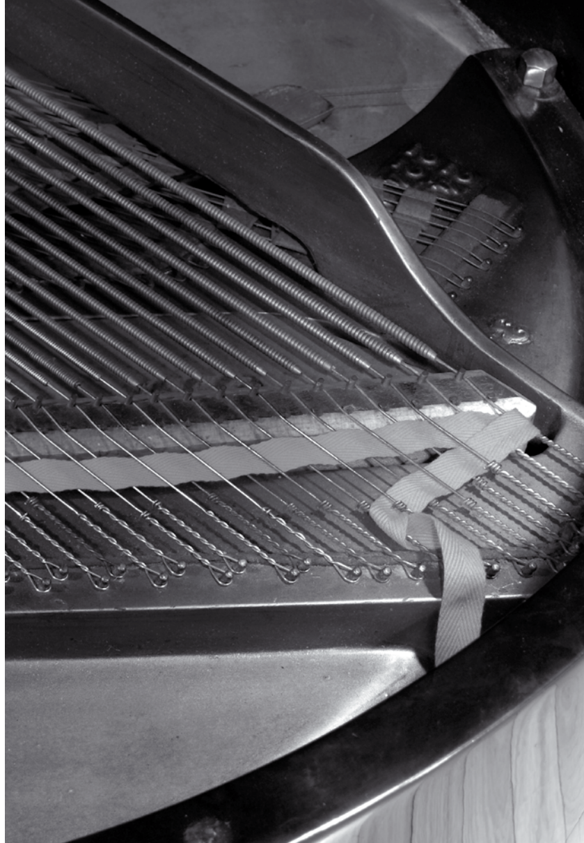
EL PIANO SOLISTA (VIII) / CARLOS LAMA & SOFÍA CABRUJA