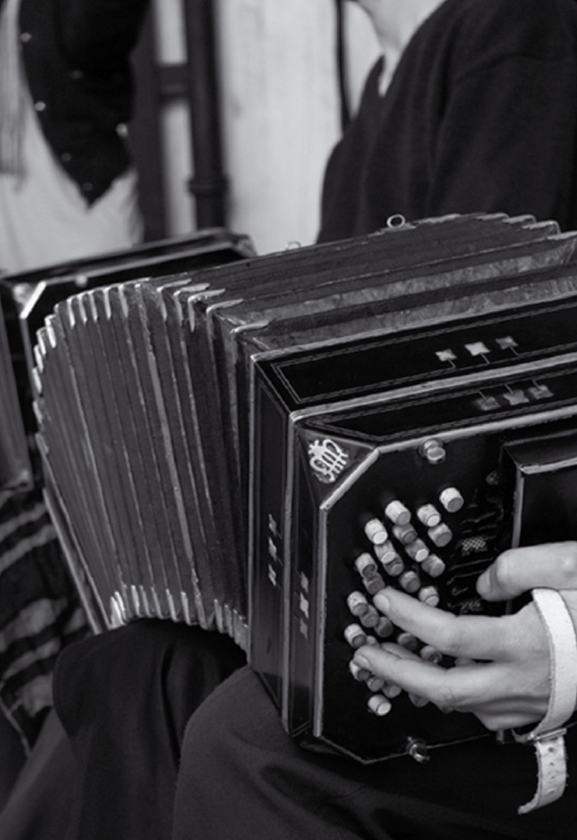
JAZZ EN EL CCE (VIII) / HUGO FATTORUSO