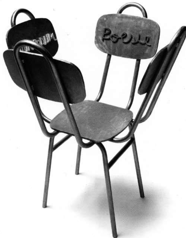
HORACIO SAPERE: POET'S ROOM. TEOREMA