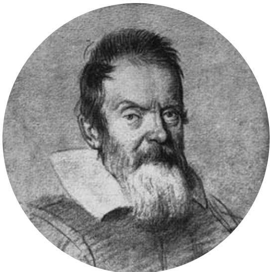
GALILEO GALILEI / UNA MIRADA QUE CAMBIÓ AL MUNDO