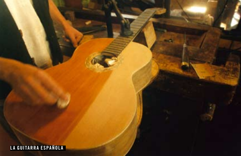
LA GUITARRA ESPAÑOLA