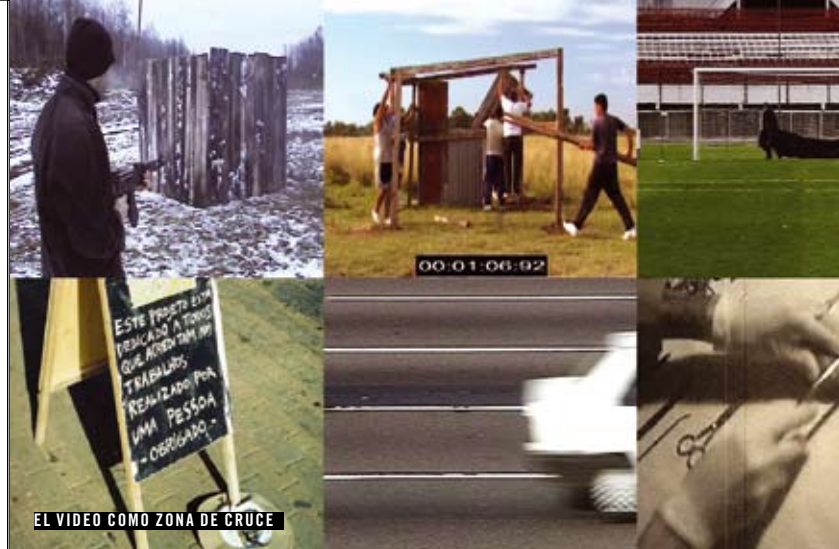
EL VIDEO COMO ZONA DE CRUCE

PROGRAMACIÓN NO APTA PARA MENORES DE 18 AÑOS