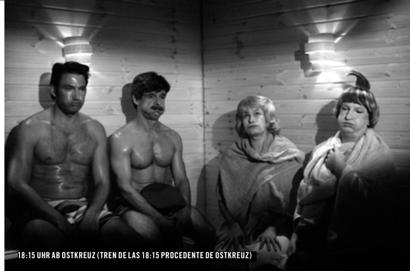
18:15 UHR AB OSTKREUZ (TREN DE LAS 18:15 PROCEDENTE DE OSTKREUZ)

PROGRAMACIÓN NO APTA PARA MENORES DE 18 AÑOS