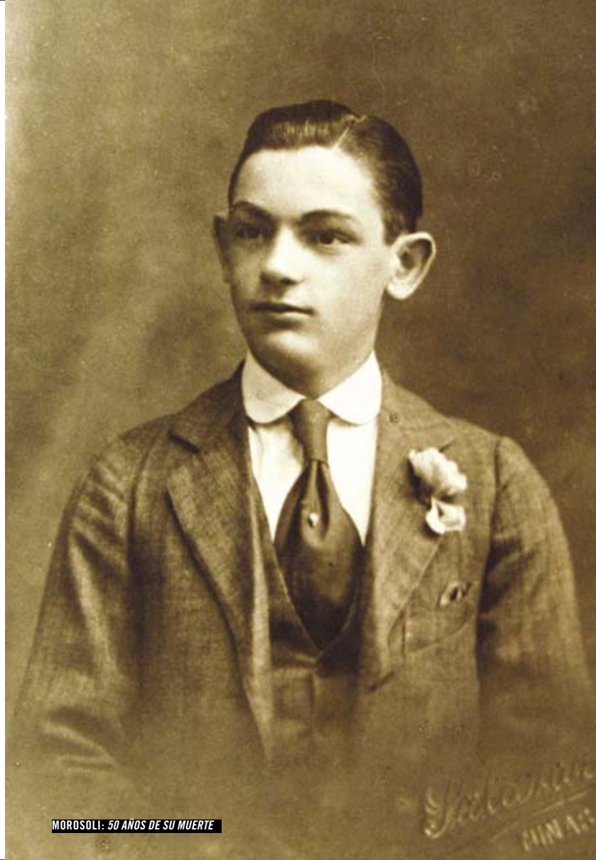
MOROSOLI: 50 AÑOS DE SU MUERTE

Para la presentación de todas las muestras contamos con el apoyo de las Direcciones de Cultura de cada departamento.